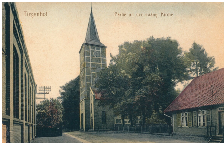
Il. 2: Widok na wieżę dawnego kościoła ewangelickiego w Nowym Dworze Gdańskim.

Niniejszy tekst stanowi próbę ukazania okoliczności budowy pierwszego kościoła luterańskiego w Nowym Dworze Gdańskim. Przeprowadzona przez autorów analiza źródłowa, pozwala jednoznacznie stwierdzić, że w dotychczasowej literaturze funkcjonuje uproszczony, bądź nawet fałszywy obraz początków budowy świątyni 49 . Wskazuje się tam bowiem, że 8 sierpnia 1784 roku jedno z pomieszczeń zamkowych zostało przeznaczone na potrzeby lokalnej wspólnoty luterańskiej. Tymczasem z analizy źródeł wynika, że takie pomieszczenie istniało w zamku nowodworskim przynajmniej od 1773 roku. Dnia 8 sierpnia 1784 roku wybudowano natomiast z materiałów pochodzących z rozbiórki XVI-wiecznego obiektu nową, prowizoryczną świątynię, która przetrwała do lat 30. XIX wieku, kiedy to wybudowano nowy kościół, według projektu Ferdinanda von Bussego. Przedstawione w tekście początki budowy pierwszego kościoła ewangelickiego w Nowym Dworze Gdańskim mają fundamentalne znaczenie dla dziejów miejscowości, bowiem to właśnie w tym czasie zapada decyzja o rozbiórce jednego z symboli Nowego